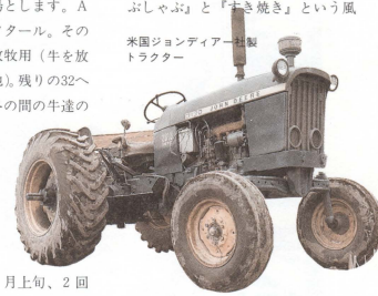
米国ジョンディア製トラクター

1回目は5月下旬~6月上旬、2回目は7月下旬~8月上旬、3回目は9月中旬~9月下旬です。刈り取られた牧草は次に2種類の餌に作られます。まずひとつは「サイレージ」。これは、牧草を生のまま貯蔵し発酵させたもので、慣れない人が近寄るとその強烈な臭いにたまげてしまいます。ふたつ目は「乾草」。これは、