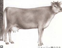
ジャージー種の牛