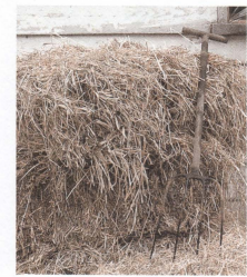
干し草のキューブとフォーク