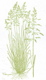
②ケンタッキーブルーグラス