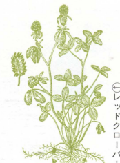
⑤レッドクローバー