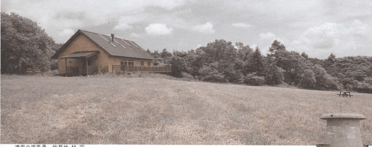
清里の原風景-牧草地・林・空