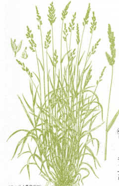
④リードキャナリー