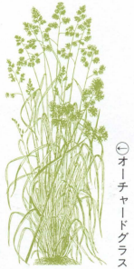
①オーチャードグラス